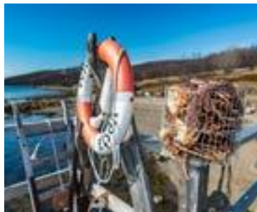
VERTREK VANUIT BERGEN 2020