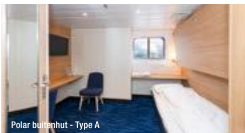
Polar buitenhut - Type A