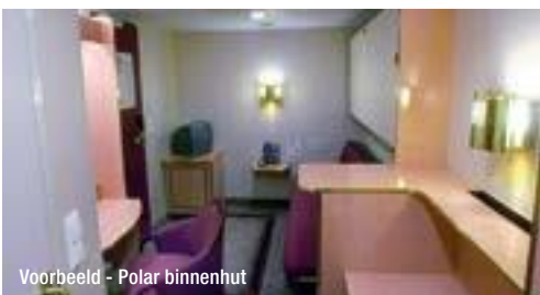
Voorbeeld - Polar binnenhut