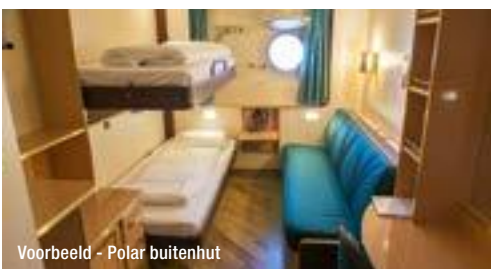
Voorbeeld - Polar buitenhut